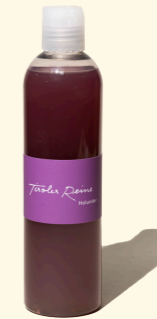
Holunder - die Geborgenheit 300ml

Die schwarzvioletten Beeren, die zu Marmelade und Saft verarbeitet werden, bereiten uns auf die kalte Jahreszeit vor. Die Tiroler Reine Seife Holunder vermittelt in der Farbe tiefe Kraft und im Duft einen starken Geist.