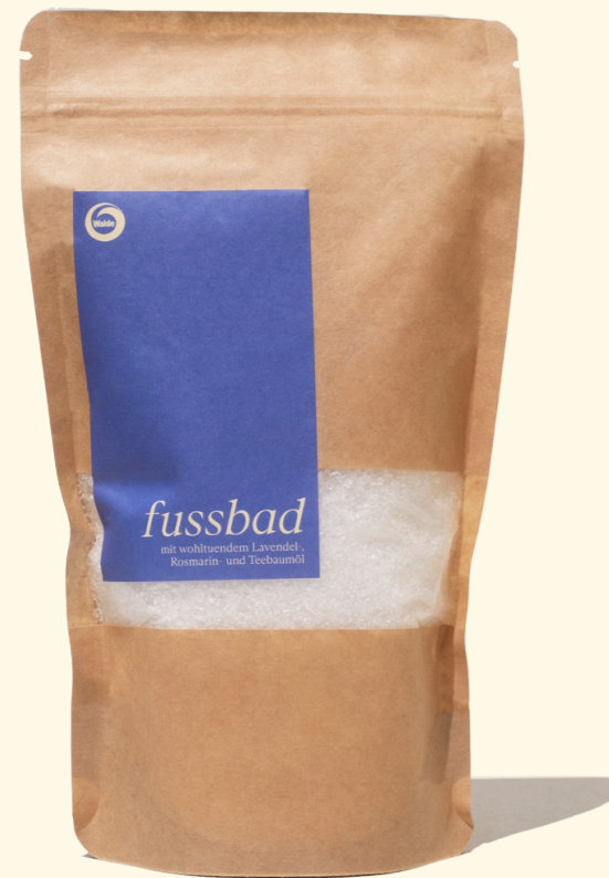
Lavendel, Rosmarin & Teebaumöl 500g

Die Mischung aus Meersalz und Magnesium, angereichert mit Papain (aus der Papayafrucht zum Lösen der Hornhaut) und abgerundet mit ätherischem Lavendelöl, Rosmarinöl und Teebaumöl pflegt auch anspruchsvolle Füße.