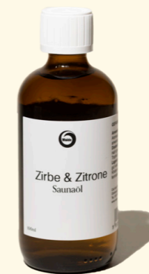
Zirbe & Zitrone 100ml

Aufgussöl Zirbe & Zitrone mit echten ätherischen Ölen für einen harmonisierenden Saunagang.