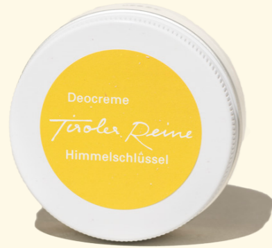
Deo Creme Himmelschlüssel 40g

Besonders sanft zur Haut, pflegend und sehr ergiebig, ein ganz neues Deo Erlebnis. Sheabutter wirkt beruhigend und spendet Feuchtigkeit, Kokosöl desodoriert, wertvolle Kakaobutter und Mandelöl pflegen sanft. Die Deo Creme zieht sehr schnell ein und hinterlässt keine weißen Spuren auf der Kleidung. Die Tiroler Reine Deo Creme verhindert nicht das Schwitzen, sondern den unangenehmen Geruch. Eine Fingerspitze für einen ganzen Tag Frische. Frei von Aluminiumsalzen, Konservierungsmitteln und Alkohol.