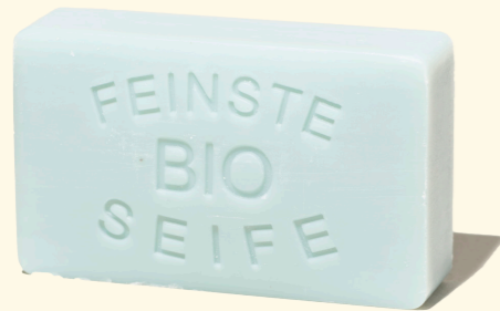
Lavendel 100g mit Mandelöl - entspannt genießen 1361