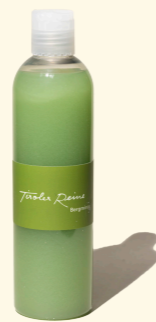
Bergminze - die Frische 300ml

Seit frühesten Zeiten gilt die Minze als das Symbol der Gastfreundschaft, der Lebenskraft und vor allem der leidenschaftlichen Liebe. Der Charakter der Tiroler Reine Bergminze ist entsprechend der Kraft der Minze: stark und klar, frisch und wach.