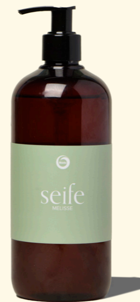
Seife Melisse 500ml

Mit anregend frischem Duft, der die Sinne belebt.