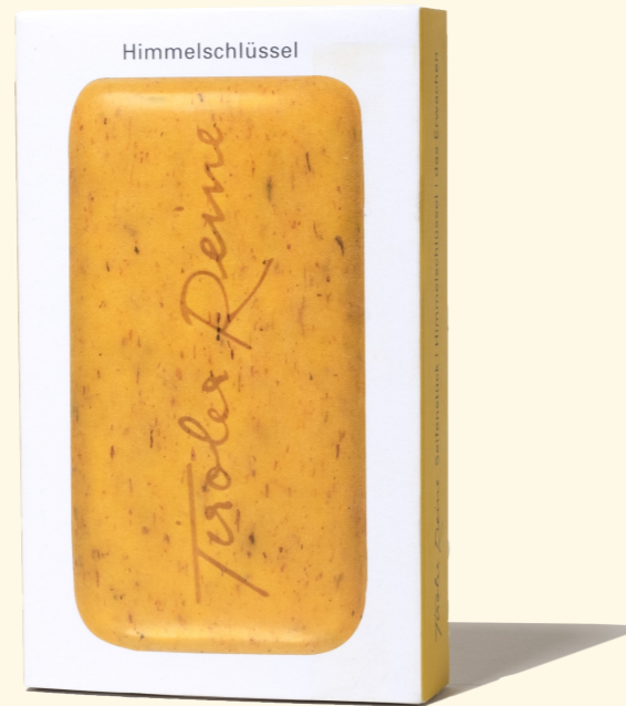
...und so wird's verpackt!

Alle Tiroler Reine festen Seifen sind VEGAN und PALMÖLFREI.