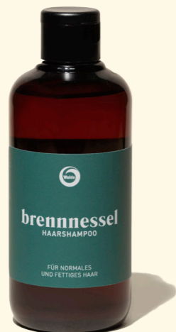
Brennnessel 250ml & 1l

erfrischendes Shampoo mit Brennnessel- und Birkenextrakt für normales und rasch nachfettendes Haar