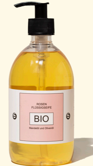
Rose 500ml 1421