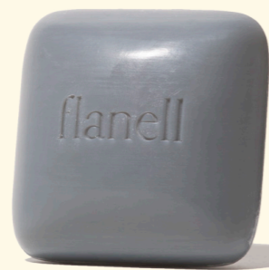
feste Seife Flanell 100g

Walde Seife FLANELL für Körper, Gesicht und Hände, verseift aus wertvollem Olivenöl, Kokosöl und Sheabutter, reinigt sanft und unterstützt die natürliche Hautbalance. Diese Seife ist palmölfrei, vegan und kommt in einer Recyclingverpackung zu Ihnen nach Hause.