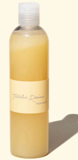
Alpenspeik - die Ruhe 300ml

Herb, frisch, leicht holzig, mit einer dezenten Brise Lavendel. Vielleicht ist es die Tatsache, dass Speik schon in früheren Zeiten vielfach verwendet wurde, die die Alpenspeik-Seife für Nase und Haut zu einem Klassiker unter den Tiroler Reinen gemacht haben.