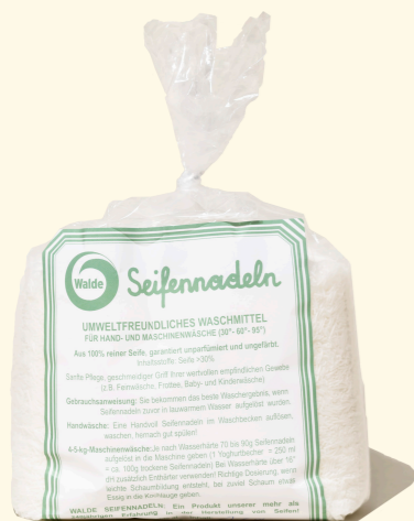
Seifennadeln 4kg & 1kg

Aus 100% reiner Seife, garantiert unparfümiert und ungefärbt - ideal für Hand- und Maschinenwäsche.