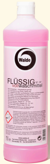
Vollwaschmittel flüssig 1l

Blumig duftendes Vollwaschmittel, geeignet für Weiß- und Buntwäsche. Der Packungsinhalt reicht für ungefähr 34 Waschgänge.