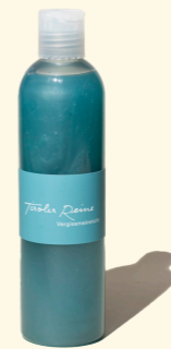
Vergissmeinnicht - die Erinnerung 300ml

Für die Tiroler Reine Seife Vergissmeinnicht wurden Duft und Farbe der feinen Blüten nachempfunden – wie das Bild einer Blumenwiese, in der das kleine Blaue ins Auge fällt.