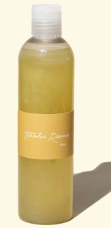
Heu - die Wärme 300ml

Der Duft von sonnengetrocknetem Heu löst ein besonderes Wohlgefühl aus. Schon vor Generationen half man sich mit einer Handvoll Heu, das man zwischen Kachelofen und Rücken legte. So ließ man die Wärme des Heus seine Wirkung tun.