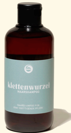
Klettenwurzel 250ml & 1l

Kräftigendes Haarshampoo mit Klettenwurzel- und Kamillenextrakt.