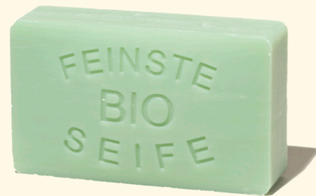
Zedernholz 100g mit Mandelöl - herb belebend 1363