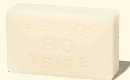
Natur 100g mit Mandelöl - für alle die das Pure lieben 1360