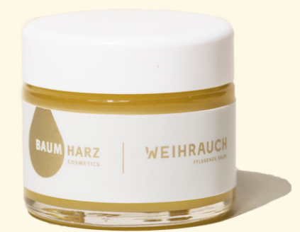
Pflegende Salbe 50ml

Intensiv pflegende Salbe aus Olivenöl, Lanolin, Bienenwachs und echtem grünem Weihrauch aus dem Oman. Wohltuend bei sehr trockener, stark beanspruchter Haut, auch zur Massage bestens geeignet.