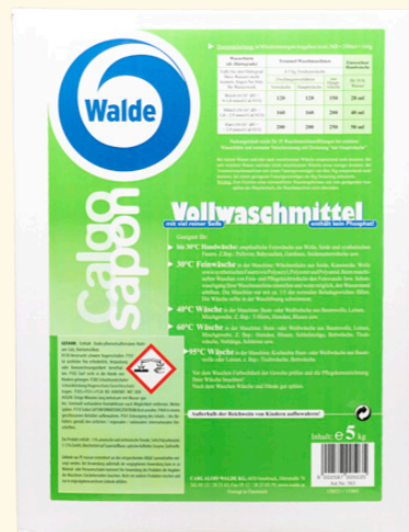
Calgo Sapon Vollwaschmittel 5 kg

Vollwaschmittel mit einem hohen Anteil reiner Seife. Das Produkt enthält kein Phosphat und eignet sich für Waschttemperaturen von 30 bis 95 Grad.