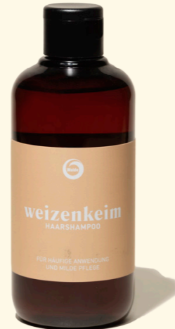
Weizenkeim 250ml & 1l

Haarshampoo mit Weizenkeimprotein für häufige Anwendung und milde Pflege