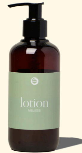
Lotion Melisse 250ml

Walde Körperlotions pflegen Ihre Haut mit wertvollen pflanzlichen Ölen und Extrakten, unterstützen den Feuchtigkeitshaushalt und sorgen so für ein angenehmes Hautgefühl.