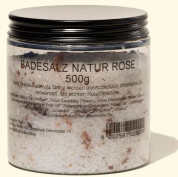
Rose 500g verführerisch & sinnlich 2902