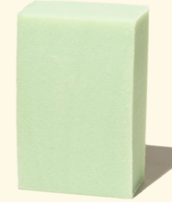
Aloe Vera 100g

Aloe Vera ist ein seit der Antike bekanntes Schönheitsgeheimnis. Die Seife erhält die Feuchtigkeit der Haut und hinterlässt ein geschmeidiges Hautgefühl. Geeignet für Hände, Gesicht und Körper.