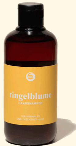
Ringelblume 250ml & 1l

mildes Shampoo mit Ringelblumen- und Granatapfelkernextrakt für normales und trockenes Haar.