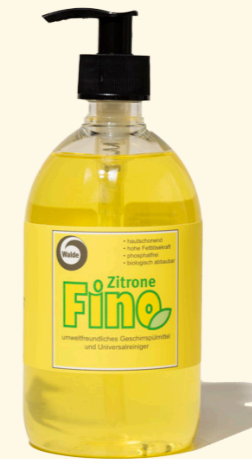
Fino Zitrone 500ml

Frisch duftendes Geschirrspülmittel, welches schonend zur Haut ist und gleichzeitig eine hohe Fettlösekraft besitzt.