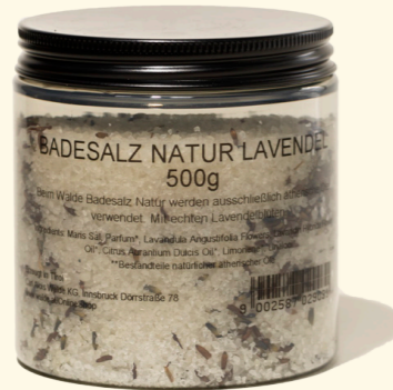
Lavendel 500g wohltuend & beruhigend 2903