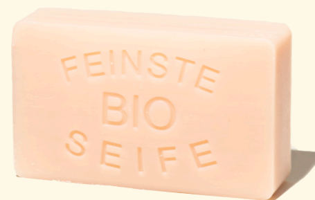
Rose 100g mit Mandelöl - sinnlich verwöhnend 1362