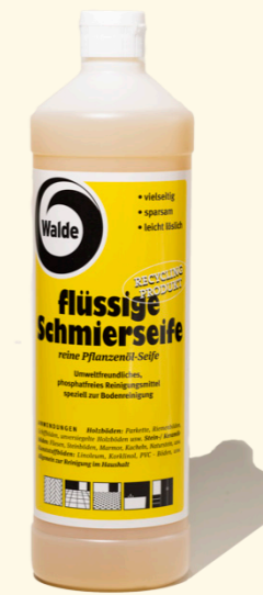
Flüssige Schmierseife 1l

Phosphatfreies Reinigungsmittel, welches vielseitig und sparsam einsetzbar ist. Das Recycling Produkt ist leicht löslich und riecht angenehm.