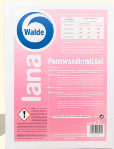
Lana Feinwaschmittel 3 kg

Ideal für die empfindliche Feinwäsche aus Wolle, Seide und synthetischen Fasern. Für Waschttemperaturen von 30 bis 60 Grad geeignet.