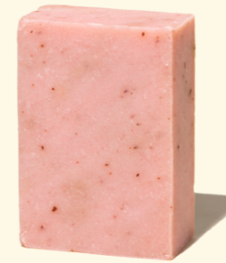
Rose mit Blüten 100g

Diese milde und gut rückfettende Seife eignet sich als Hand-, Gesichts- und Duschseife. Die Blütenblätter entfalten bei Verwendung ihren natürlichen Rosenduft. Die Seife bildet einen geschmeidigen und cremigen Schaum, durch die Rosenblüten entsteht ein leichter Peeling Effekt.