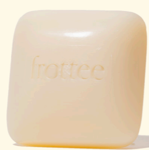
feste Seife Frottee 100g

Walde Seife FROTTEE für Körper, Gesicht und Hände, verseift aus wertvollem Olivenöl, Kokosöl und Sheabutter, reinigt sanft und unterstützt die natürliche Hautbalance. Diese Seife ist palmölfrei, vegan und kommt in einer Recyclingverpackung zu Ihnen nach Hause.