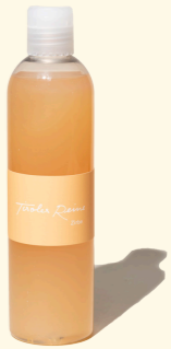
Zirbe - die Harmonie 300ml

Die außergewöhnlichen Kräfte der majestätischen Zirbe werden seit Jahrhunderten geschätzt und genutzt. Der unverwechselbare Duft unserer Seifen, für die wir reines Tiroler Zirbenöl verwenden, spiegelt die Urkraft der Königin der Alpen, wie die Pinus cembra zurecht genannt wird, wider.