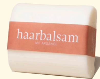
fest 100g 2413

Unseren Haarbalsam gibt es in fester und flüssiger Form zur Pflege von strapaziertem Haar und für eine bessere Kämmbarkeit. Neben Arganöl enthalten die Produkte verschiedene Wirkstoffe wie pflanzliches Squalan und wertvolle Sheabutter. Einfach nach der Haarwäsche auf die Längen und Spitzen auftragen und einwirken lassen, ausspülen und seidiges Haar genießen.