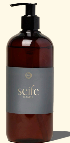
Seife Flanell 500ml

Mit frisch-belebendem Duft – für ein wahres Dufterlebnis.