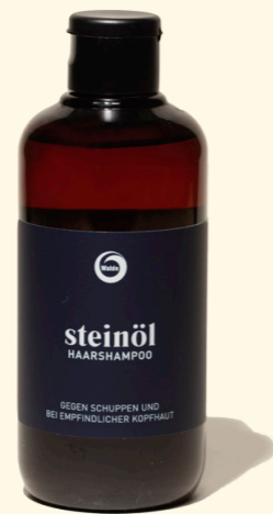
Steinöl 250ml & 1l

Haarshampoo mit echtem Steinöl aus der Region Achensee gegen Schuppen und bei empfindlicher Kopfhaut.