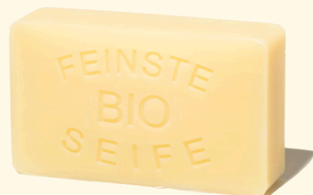
Zitrone 100g mit Mandelöl - heiter erfrischend 1364