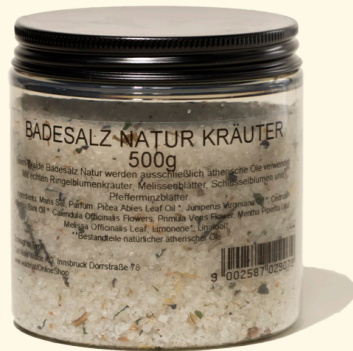
Kräuter 500g vitalisierend & erfrischend 2907

mit reinem Meersalz, echten Blüten und ätherischen Ölen. Regt die Durchblutung an und pflegt die Haut.