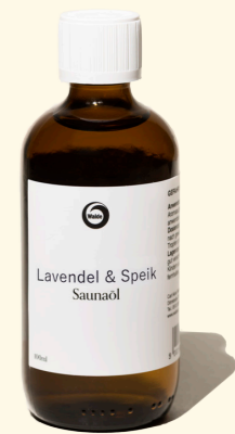
Lavendel & Speik 100ml

Das Aufgussöl Lavendel-Speik mit echtem ätherischem Öl sorgt für ein besonderes Saunaerlebnis.