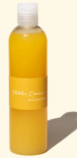
Himmelschlüssel - das Erwachen 300ml

Wenn die zart duftenden, leuchtend gelben Blüten der Himmelschlüssel ans Licht kommen, künden sie von neuem Leben nach kalter Jahreszeit. Wenn das morgendliche Erwachen vom süß-zarten Duft dieser Seife begleitet wird, hält für einen Moment der Frühling Einzug in unser Badezimmer.