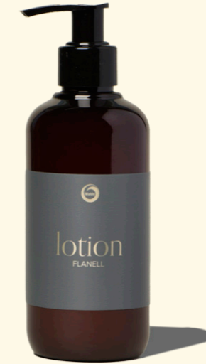
Lotion Flanell 250ml

Mit frischem, belebendem Duft der Sie durch den Tag begleitet.