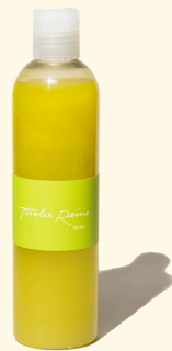
Birke - das Glück 300ml

Sie gilt als Baum des Lebens, der Liebe, der weiblichen Schönheit und des Glücklicheins. Wir haben uns den Duft der Birke, würde sie denn stark duften, so vorgestellt: leichtfüßig, umschmeichelnd, erhellend – wie die Tiroler Reine Seife Birke.