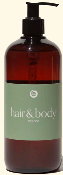
Hair & Body Melisse 500ml

Alle Sorten sind VEGAN und kommen in Spenderflasche aus Recyclingmaterial.