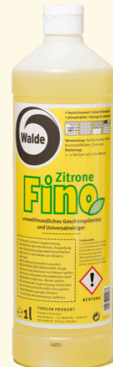
Fino Zitrone 1l

Phosphatfreier Universalreiniger und Geschirrspülmittel aus Tirol. Das Produkt ist ergiebig in der Anwendung und biologisch abbaubar.