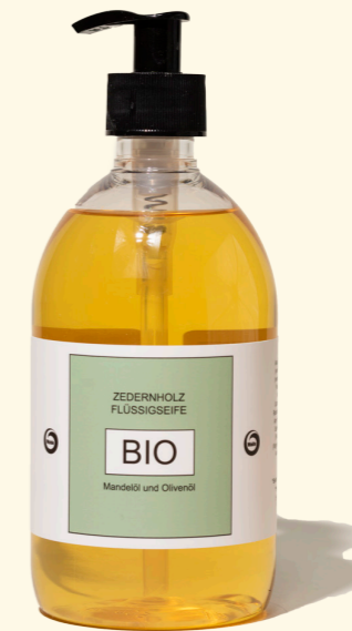
Zedernholz 500ml 1422