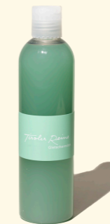
Gletschermilch - die Tradition 300ml

In der Tiroler Reine Seife vereinen sich die Farbe der Gletschermilch, die in der Zeit der Schnee- und Eisschmelze die Bergbäche füllt, und der Duft aus Großmutterns Zeiten.