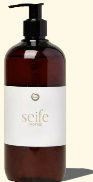
Seife Frottee 500ml

Mit weichem, sinnlichem Duft der Sie verwöhnt.