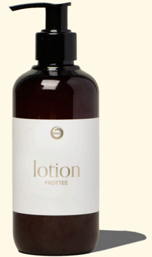
Lotion Frottee 250ml

Warm und weich umhüllt Sie der kostbare Duft – ein sinnliches Vergnügen.