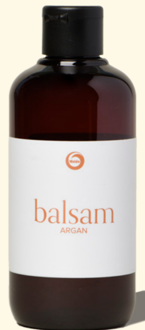
flüssig 250ml 3706