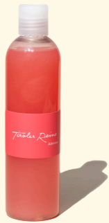
Almrose - die Liebe 300ml

Wenn im Mai und Juni die Hänge der Alpen bis über die Waldgrenze purpurrot leuchten, hat die Blütezeit der Almrose begonnen. Der zart-liebliche Duft der Seife soll an dieses unvergleichliche Gefühl des ersten Verliebtseins erinnern.