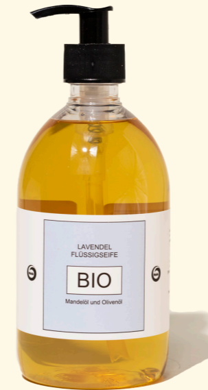
Lavendel 500ml 1420