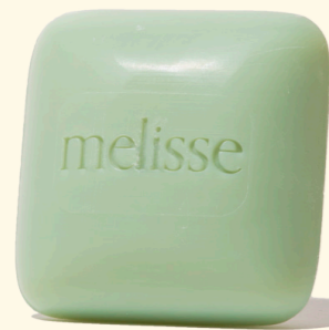
feste Seife Melisse 100g

Walde Seife MELISSE für Körper, Gesicht und Hände, verseift aus wertvollem Olivenöl, Kokosöl und Sheabutter, reinigt sanft und unterstützt die natürliche Hautbalance. Diese Seife ist palmölfrei, vegan und kommt in einer Recyclingverpackung zu Ihnen nach Hause.