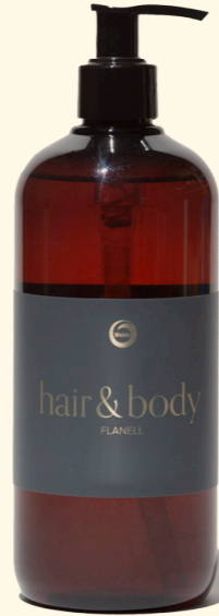
Hair & Body Flanell 500ml