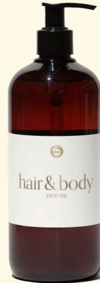
Hair & Body Frottee 500ml