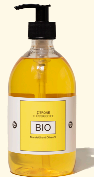
Zitrone 500ml 1423